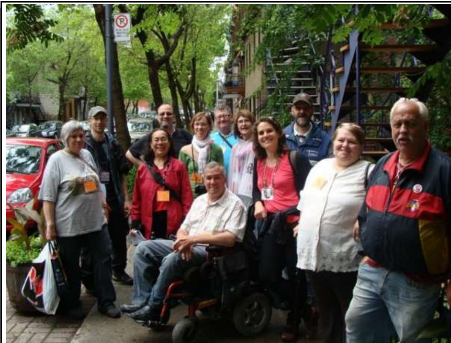
Une des trois équipes qui ont sillonné le sud-ouest du quartier le 28 mai 2011.