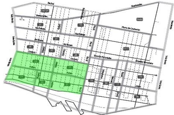
Secteur d'intervention de l'OPA Sud-Ouest

En mai 2011, une cinquantaine de citoyennes et citoyens du Sud-Ouest d'Hochelaga-Maisonneuve se sont mobilisés dans une Opération populaire d'aménagement (OPA) pour observer, planifier et agir sur leur quartier. Quatre thèmes furent ciblés: les parcs et espaces verts, la qualité de vie et les infrastructures, la circulation, les commerces. Le secteur d'intervention est le Sud-Ouest du quartier, soit le quadrilatère composé par les rues Ontario au nord, Notre-Dame au sud, la voie ferrée à l'ouest et le Boulevard Pie-IX à l'est.