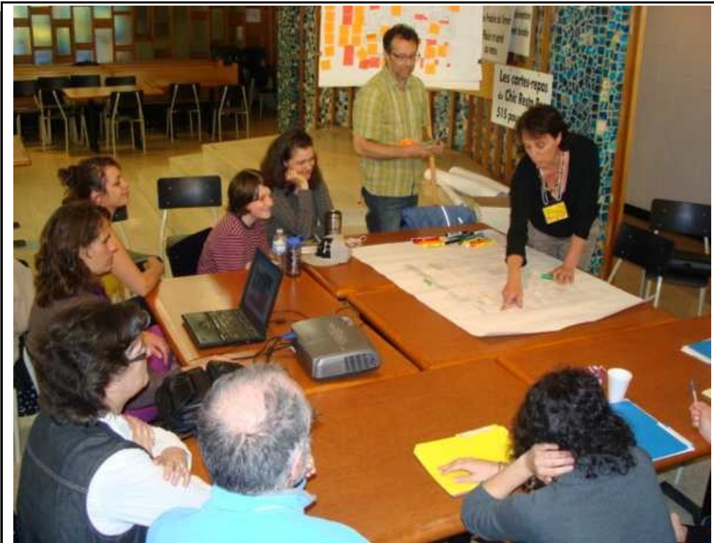
La réflexion collective, l'autoformation, l'utilisation de l'expertise citoyenne sont des principes fondamentaux de l'OPA.