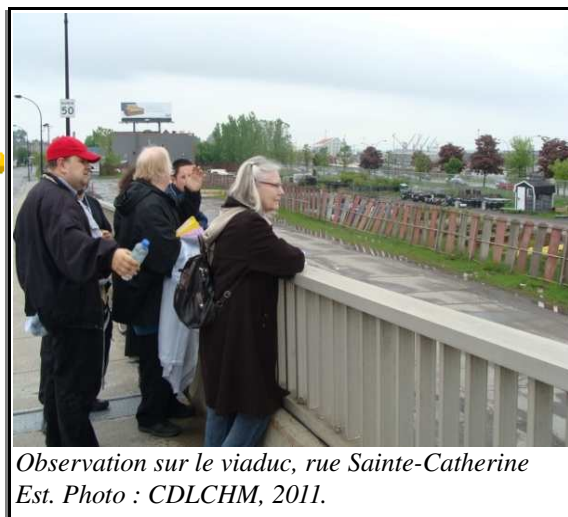
Observation sur le viaduc, rue Sainte-Catherine Est. Photo : CDLCHM, 2011.

Les participantes et les participants mentionnent que la qualité de vie dans le quartier, bien que s'étant améliorée depuis quelques années, est au mieux « moyenne ». Plusieurs raisons appuient cette perception : le bruit et la poussière dus à la circulation sur les rues Notre-Dame et Sainte-Catherine Est, mais aussi la prostitution de rue, la saleté des ruelles, le manque d'infrastructures et la sécurité.